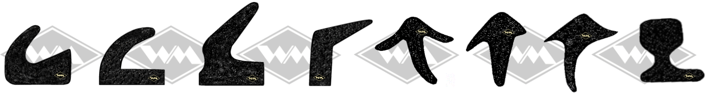
3002 B/H=17/16 mm 31029 B/H=17/16 mm 3321 B/H=16,5/22 mm 31672 B/H=7/21 mm 31034 H=17 mm 31680 H=20 mm 31681 H=21 mm 31027 H=18 mm

überwiegend offenzellige Struktur mit dichter Außenhaut