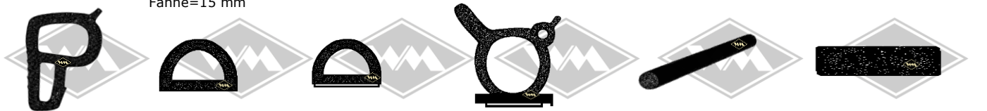
31420 Hohlkammerprofil B/H = 13/19 mm 31150 Hohlkammerprofil B/H 15/12 mm 321210 Hohlkammerprofil Unterseite selbstklebend (als Montagehilfe) Maße: Breite x Höhe B/H 12/10 mm 322020K Hohlkammerprofil Koextrusionsprofil EPDM Moosgummi/Gummi Unterseite dauerhaft selbstklebend B/H = 20/20 mm Rundschnur 31004 Ø 4 mm 31005 Ø 5 mm 31006 Ø 6 mm 31008 Ø 8 mm 31010 Ø 10 mm 31012 Ø 12 mm 31015 Ø 15 mm 31020 Ø 20 mm Rechteckprofil 310408 4 x 8 mm 310540 5 x 40 mm 310610 6 x 10 mm 310615 6 x 15 mm 311015 10 x 15 mm 311020 10 x 20 mm 311030 10 x 30 mm 311212 12 x 12 mm 311520 15 x 20 mm 312025 20 x 25 mm 312030 20 x 30 mm 312530 25 x 30 mm