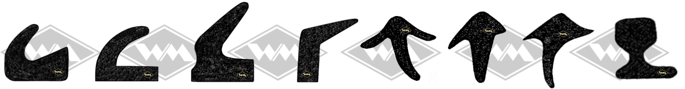
3002 B/H=17/16 mm 31029 B/H=17/16 mm 3321 B/H=16,5/22 mm 31672 B/H=7/21 mm 31034 H=17 mm 31680 H=20 mm 31681 H=21 mm 31027 H=18 mm

überwiegend offenzellige Struktur mit dichter Außenhaut