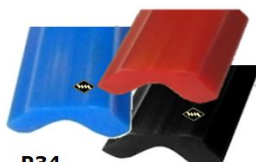
P34 Einlegeband u. a. für 40 mm DDR- Leiste, 17 mm breit blau, rot, schwarz