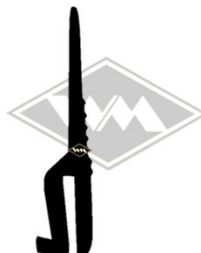
P17 Scheinwerfer- blendenprofil