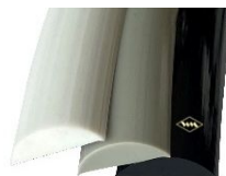
P6 Füllerprofil weiß, grau, schwarz 13 mm breit