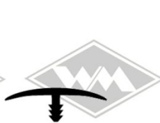
P49 Abdeckprofil 22 x 7 mm, PVC