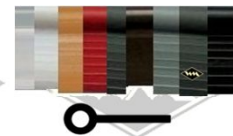
P8 PVC-Biese 4x10 mm transparent, weiß, terrakotta, rot, dunkelgrün, braun, grau, anthrazit, schwarz