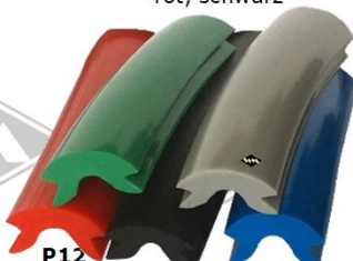
P12 Einschiebepprofil Leiste schwarz, rot, blau, grau grün / 13 mm breit