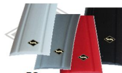
P2 Füllerprofil Leiste 12 mm breit weiß, silbergrau, rot, schwarz