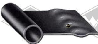
P45 Kotflügelkeder 9,5/28mm