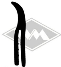
861 IWL-Troll Gummi EPDM EUR 5,90/m*