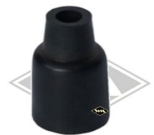
G80 Gummikappe Zündkerzenstecker Ø innen ca. 6/12 mm 30 mm hoch EUR 2,00/St*