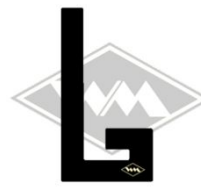
702 IWL-Wiesel/Berlin Gummi EPDM EUR 6,35/m*