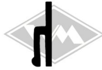
802 MZ/Simson/Star Gummi EPDM EUR 4,70/m*