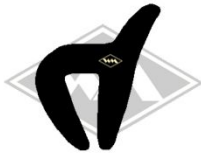
561 IWL-Troll Gummi EPDM EUR 5,50/m*