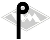
901 u.a. MZ-ES250 Gummi EPDM EUR 3,80/m*