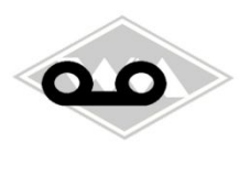
801 IWL-Wiesel/ Gummi EPDM Berlin/MZ, Simson EUR 4,95/m*