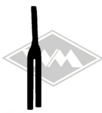
870 diverse Gummi EPDM EUR 4,00/m*