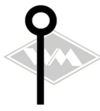
601 u.a. IWL-Wiesel/ Gummi EPDM Berlin/Pitty EUR 4,30/m*