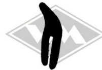
7981 diverse Gummi EPDM EUR 3,95/m*