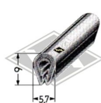
P22 Zierriem PVC eloxiert (chrom) EUR 3,10/m*