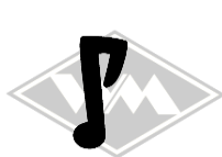
301 IWL-Troll Gummi EPDM EUR 4,95/m*