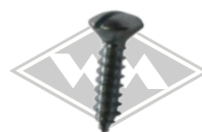
M62-10 Linsensenkblechschraube 2,9 / 9,5 mm (Ø Schraubenschaft / Länge) EUR 0,10/St*