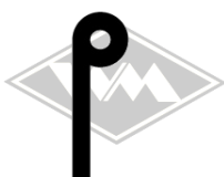
901 u.a. MZ-ES250 Gummi EPDM EUR 3,60/m*