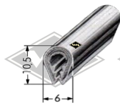
P23 Zierriem PVC eloxiert (chrom) EUR 3,30/m*