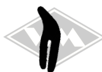
7981 diverse Gummi EPDM EUR 3,95/m*