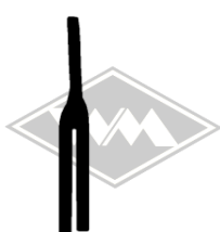
870 diverse Gummi EPDM EUR 4,00/m*