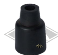
G80 Gummikappe Zündkerzenstecker Ø innen ca. 6/12 mm 30 mm hoch EUR 2,00/St*