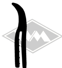
861 IWL-Troll Gummi EPDM EUR 5,90/m*