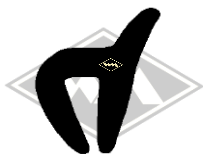
561 IWL-Troll Gummi EPDM EUR 5,50/m*