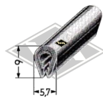
P22 Zierriem PVC eloxiert (chrom) EUR 2,90/m*