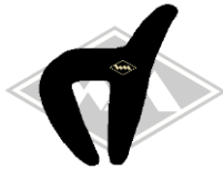
561 IWL-Troll Gummi EPDM EUR 5,50/m*