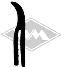
861 IWL-Troll Gummi EPDM EUR 5,90/m*