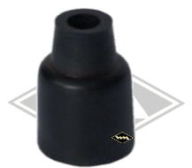
G80 Gummikappe Zündkerzenstecker Ø innen ca. 6/12 mm 30 mm hoch EUR 2,00/St*