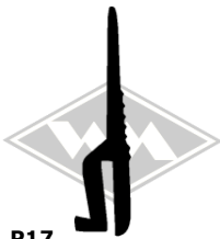
P17 Scheinwerferblenden- profil PVC EUR 3,90/m*