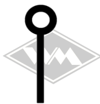
601 u.a. IWL-Wiesel/ Gummi EPDM Berlin/Pitty EUR 4,30/m*