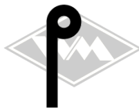
901 u.a. MZ-ES250 Gummi EPDM EUR 3,60/m*