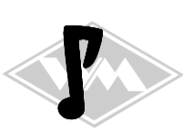
301 IWL-Troll Gummi EPDM EUR 4,95/m*