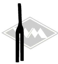
870 diverse Gummi EPDM EUR 4,00/m*