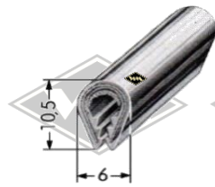
P23 Zierriem PVC eloxiert (chrom) EUR 3,30/m*