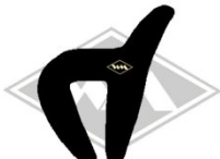
561 IWL-Troll Gummi EPDM EUR 5,50/m*