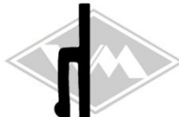
802 MZ/Simson/Star Gummi EPDM EUR 4,70/m*