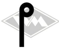
901 u.a. MZ-ES250 Gummi EPDM EUR 3,80/m*