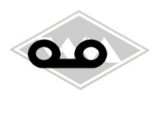
801 IWL-Wiesel/ Gummi EPDM Berlin MZ, Simson EUR 4,95/m*