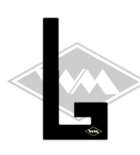
702 IWL-Wiesel/Berlin Gummi EPDM EUR 6,35/m*