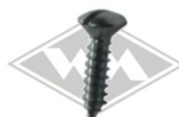
Linsensenkblechschraube Stahl verzinkt, Schlitzschraube (Ø Schraubenschaft/Länge)