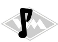
301 IWL-Troll Gummi EPDM EUR 5,30/m*