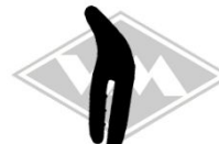
7981 diverse Gummi EPDM EUR 3,95/m*