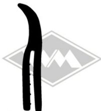
861 IWL-Troll Gummi EPDM EUR 5,90/m*