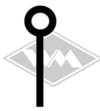
601 u.a. IWL-Wiesel/ Berlin/Pitty Gummi EPDM EUR 4,30/m*