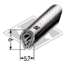
P22 Zierriem PVC eloxiert (chrom) EUR 3,10/m*